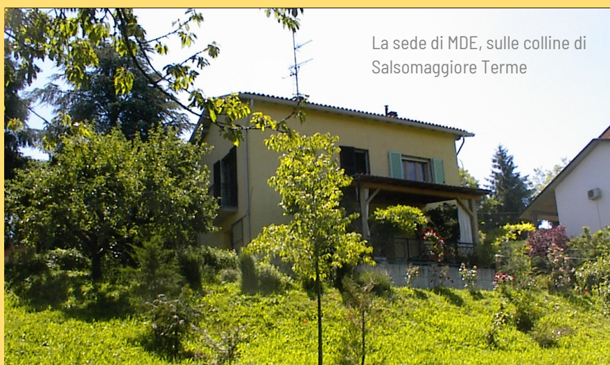
La sede di MDE, sulle colline di Salsomaggiore Terme

Inviare una mail a mdecontatti@gmail.com con i tuoi dati.