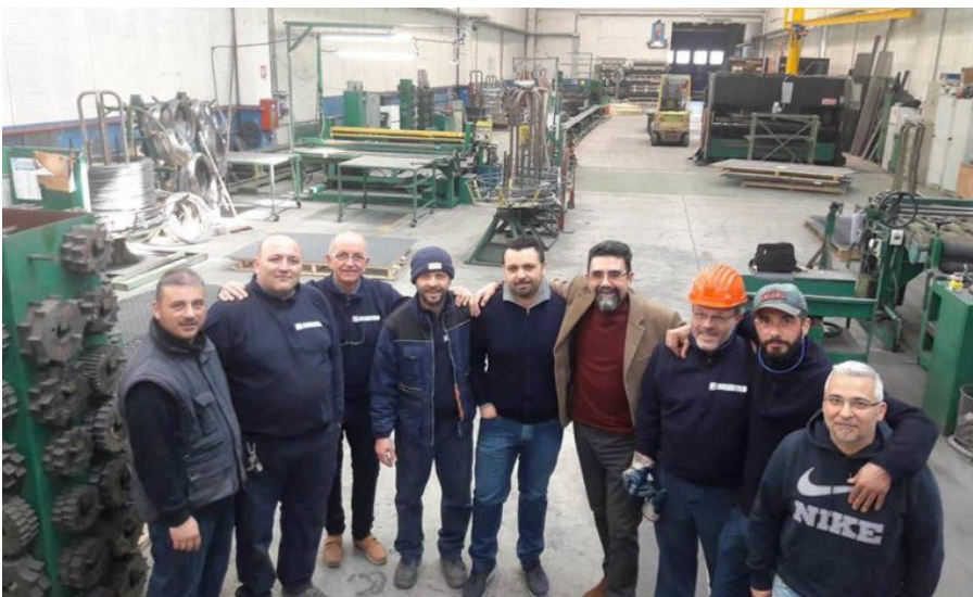
Screen Sud e i suoi 12 proprietari ce l'hanno fatta

Come si dice, volere è potere, lo sanno bene questi 12 operai diventati proprietari della propria fabbrica.